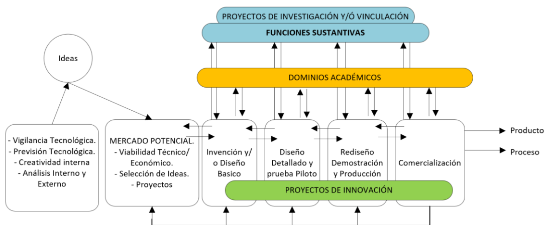
Fig. 2. Modelo del Proceso de Innovación Adoptado por el ISTLRG.

Art. 18. Modelo del Proceso de Innovación: Según las consideraciones de innovación presentadas en el Art. 16 de este Reglamento, las acciones de innovación que el ISTLRG ejecute, estarán ancladas a la estructura que se indicará en el Manual para procesos de innovación. Sin embargo, a continuación, se detalla el proceso de innovación general adoptado del modelo de Kline.